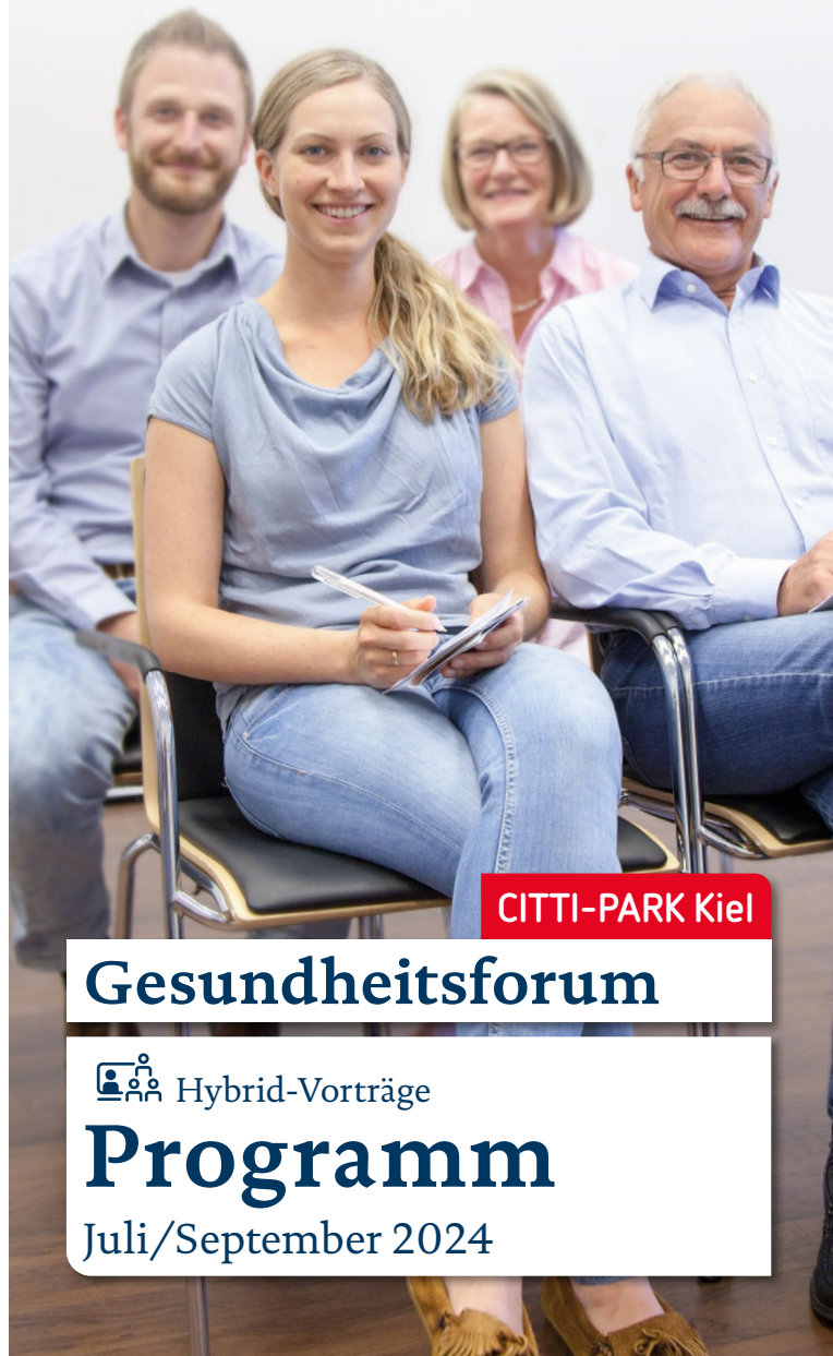
Fotos: @Dusko, Stabsstelle Integrierte Kommunikation, N. Meier, Stand Mai 2024